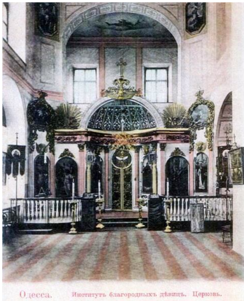
Рис. 2. Церква св. мучениці цариці Олександри в Інституті шляхетних дівчат в Одесі (лістівка початку ХХ ст.)

У 1855 р. було уніфіковано освітньо-виховний процес у закладах підвладних Відомству, а основні постулати було викладено у «Статуті жіночих закладів освіти». Відповідно до нього ключовою метою жіночих закладів освіти було виховання добрих дружин, матерів родин 10 , що було неможливим без християнського виховання. Віднині освітній процес в Інституті поділявся на три напрями: фізичне виховання, моральне виховання, розумова діяльність. Відповідно богословська освіта опинилася на перетині морального виховання і вивчення «Закону Божого» під час уроків. Для вивчення вказаної вище дисципліни в розкладі як молодших, так і старших пансіонерок відводилося по 3 години.