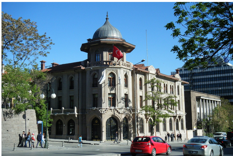
Рис. 1. Інститут Юнус Емре (Анкара, Туреччина)

Таким чином, починаючи з серпневих подій 2008 р., турецька політика «нульових проблем» піддавалася різкій критиці як у самій країні, так і в Грузії, зокрема, за невідповідність між її цілями та засобами реалізації. Після зазначених подій Туреччина намагалася нейтралізувати напругу у відносинах з Грузією розширенням співробітництва у культурних, освітніх і релігійних сферах, що ставили, крім іншого, своєю метою популяризацію «турецької моделі» розвитку держави за допомогою реалізації політики «м'якої сили».