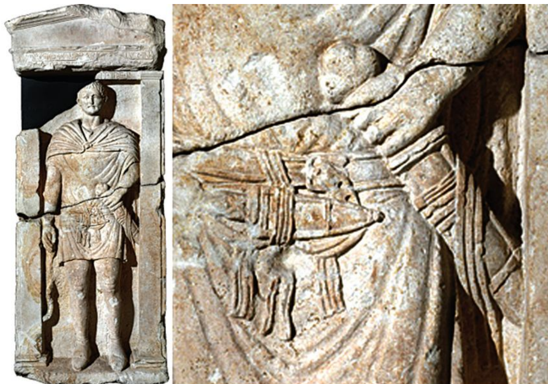
Рис. 3. Надгробок Мінучія з Падуй, Італія

Деякі мечі, датовані раннім августинським періодом – останні три десятиліття I ст. до Р.Х., схожі з пізньореспубліканськими мечами. Вони мають довгі леза, більші ніж у мечів раннього імперського періоду типу Майнц. До них належать приклади з Фонтілле (Франція) та з Джубіаско(Швейцарія) 14 .