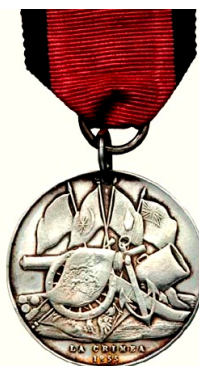
Рис. 2.2. Кримська медаль (срібло, Османська імперія, 1856)