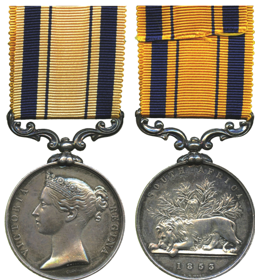
Рис. 1. Південноафриканська медаль британської армії (1854 р.) (срібло, Великобританія)

Спочатку Чарльз Кемерон обрав кар'єру військового і, придбавши офіцерський патент на звання прапорщика (молодшого лейтенанта) 5 , 19 травня 1846 р. він вступає на службу до 45-го Ноттінгемширського піхотного полку, який дислокувався на батьківщині матері (Кейптаун, Південна Африка), де прослужив до липня 1851 р. У 1854 р. його служба у резервістській частині полку була відзначена медаллю за участь у Сьомій Кафрській війні 1846-47 рр. 6 (рис. 1).