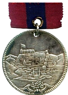
Рис. 2.1. Медаль «За оборону Карса» (срібло, Османська імперія, 1855)

правлений у фортецю Карс до підрозділу під командуванням Вільяма Фенвіка Вільямса 8 з отриманням капітанського звання турецької армії (27 березня 1855 р.). Навесні 1855 р. призначений начальником фортифікаційних укріплень Ерзерума. Після падіння Карса (листопад 1855 р.) був відряджений на спеціальну службу до Тробзона, де пробув до вересня 1856 р. За вірну службу під час російсько-турецької війни отримав дві турецьких медалі: «За оборону Карса» та «Кримську медаль» (рис. 2).