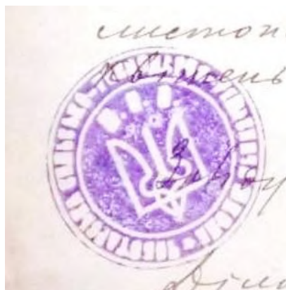
Рис. 3. Оновлена печатка школи часів гетьманату та другої УНР (1918-1920 рр.)

Напис на печатці: «Чоботарська сільсько-господарча ремісничка школа. М.Н.О.»