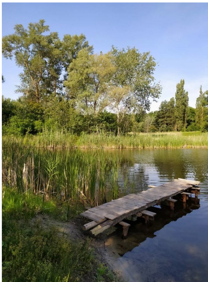
Рис. 13. Озеро на хуторі Ісаївка. Сучасний вигляд.

Залишилася Олена з трьома дітьми і все господарство лягло на її плечі. Допомігав їй по господарству сусід Григорій Саліченко, який не мав власного господарства.