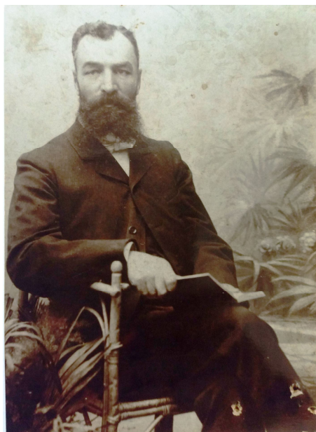
Рис. 2. Григорій Юркевич. 1860 р.

закінчення навчання її рідні придбали путівку за 98 рублів з Петербурга Балтійським морем через Німеччину, Францію, Італію, Грецію, Боснію, Хорватію, Словенію і Чорним морем повернулася до Одеси.