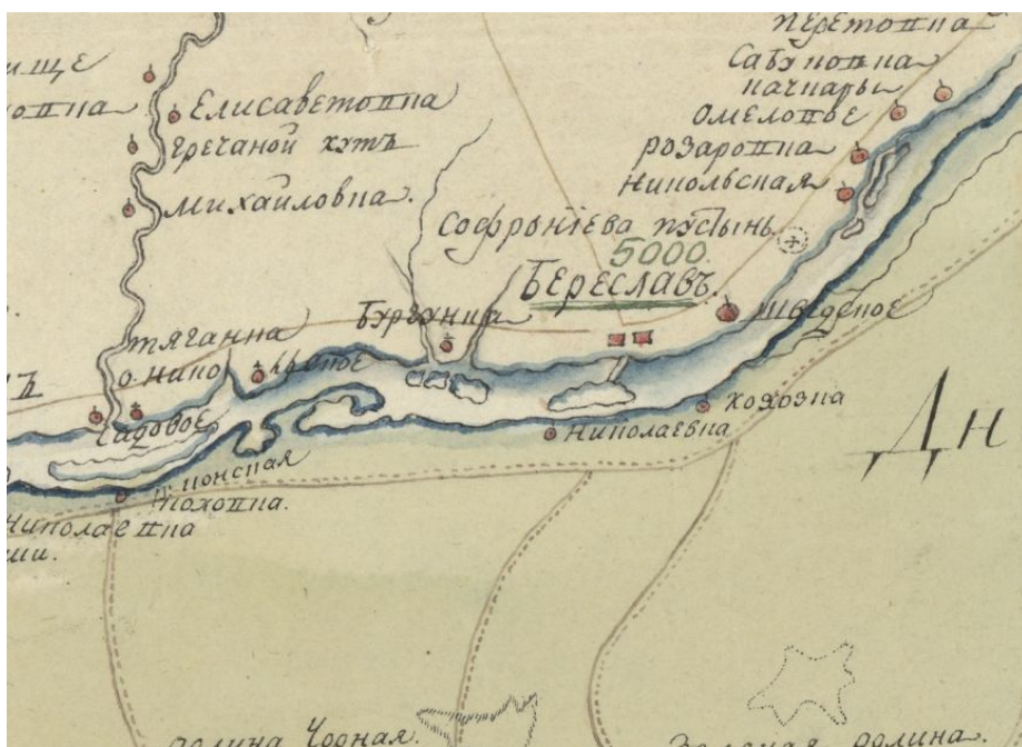
Рис. 5. Григоріївська пустинь під назвою «Софронієва» на карті 1796 р.

Куди ж ділася перша дерев'яна і з якого приводу вона так швидко знищилася, у справах свідчень не зустрічається. Кажуть лише, що побудована вона була на високому місці... й оскільки сходження на таке місце досить ускладнене, то побудова на ньому ігумену Феодосію несподівано не полюбилася, і він негайно дав розпорядження заснувати та побудувати іншу кам'яну церкву, що існує і дотепер» 81 . Коротко кажучи, згідно свідчення Гавриїла, стара церква була розібрана, а на іншому місці була побудована нова кам'яна.