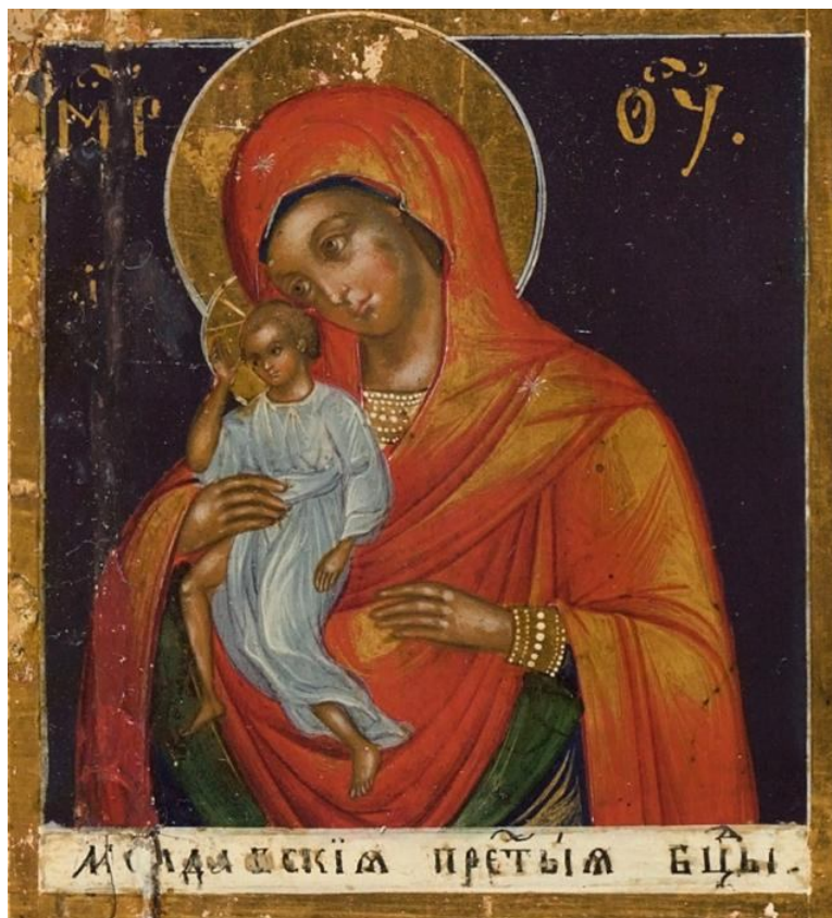
Рис. 7. Молдавська ікона Божої Матері (джерело: Вікіпедія. Наймовірно пізніша копія сер. 19 ст.)

назвою «Молдавська» 130 (рис. 7). Є версія, що ікона була повернута до Молдавії і зараз відома під іменем «Гербовецької» та зберігається у Гербовецькому Успенському монастирі (с. Гербовець Каларашського району, Молдова).