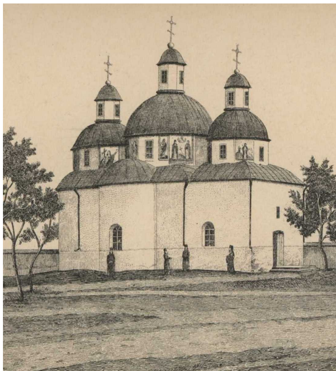
Рис. 6. Перша церква монастиря на честь Св. Григорія (фрагмент літографії кінця 19 ст. з книги Н. Ногачевського)

Отже, більш вірогідною є версія, що дерев'яну церкву дійсно розібрали та побудували нову за тим же проектом, але із кам'яними стінами (рис. 6), й опис якої надав Н. Мурзакевич. Відповідно до документів із збірника архп. Гавриїла, будівництво храму почалося у березні 1784 р. і було завершено у грудні 1786 р., а 18 травня 1787 р. церква була освячена 85 .