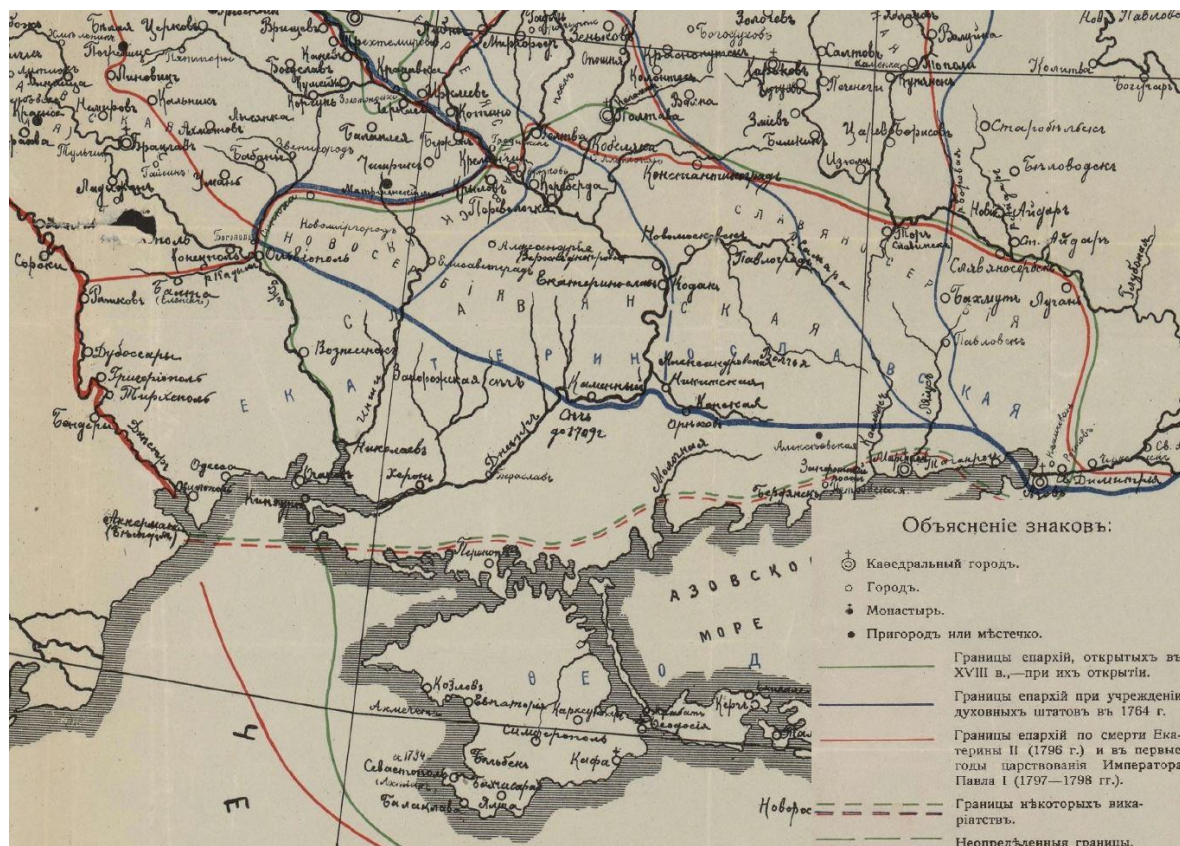
Рис. 1. Карта змін епархіального управління Півдня України у другій половині 18 ст. (Покровский И.М. Русские епархии в XVI-XIX вв.... Приложение 37 )

Маріупольського, Ростовського, Тираспольського, Перекопського й Акмечетського. Можна сказати, що у такому вигляді спархіальне управління охоплювало усю територію Південної України.