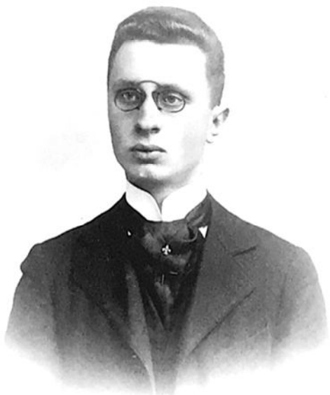
Рис. 4. Генрік Улашин (1874–1956)

Окрім важливих свідчень та інформації спогади Улашина вирізняються на тлі інших подібних я-документів стилем написання та інтелектуальним багажем автора. Як зазначалося вище, Генрік був видатним науковцем, який досліджував слов'янські мови, що мало своє відображення у певних коментарях чи зауваженнях, які робить автор спогадів. Це проявлялося в описі й оцінці польського нобілітету чи у роздумах про традиції українських селян та їх відносин з польською шляхтою. Таким чином, написаний Улашином яго-документ слугує важливим джерелом інформації у висвітленні повсякдення польської еліти у XIX ст.