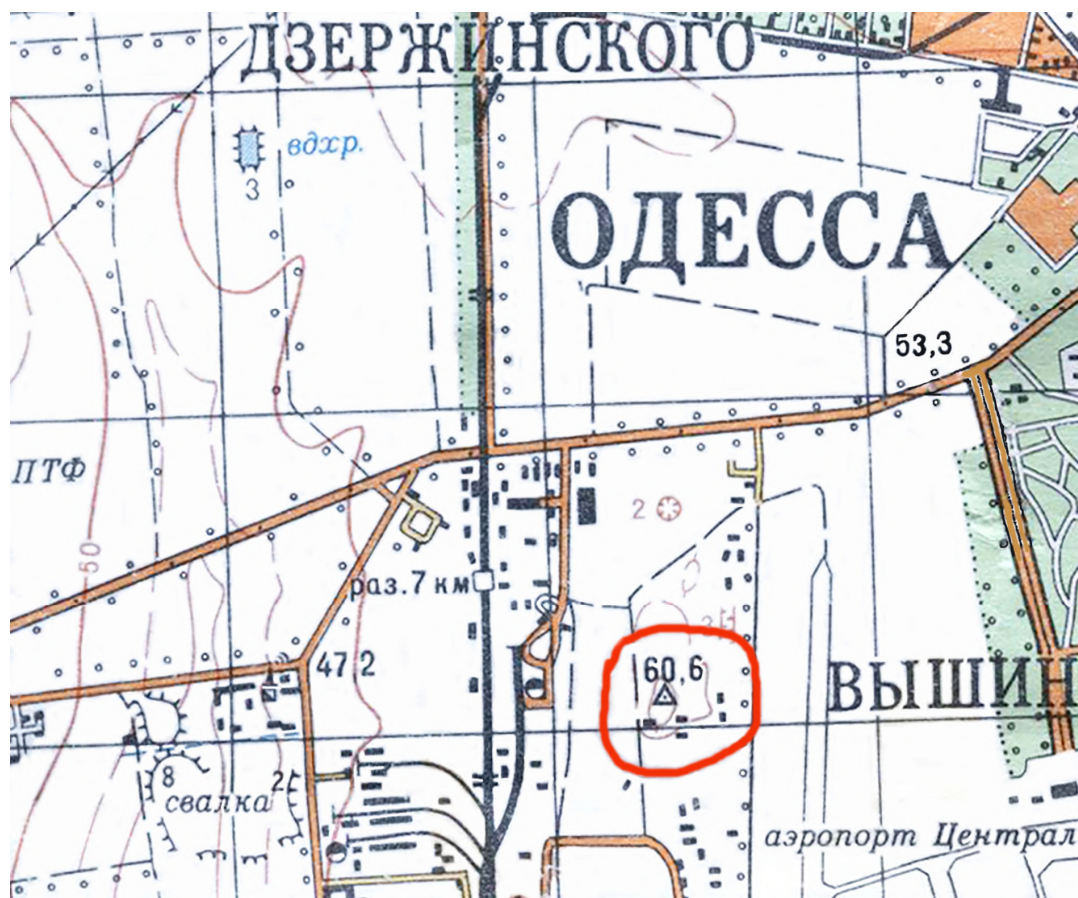
Рис. 2. Місце масових розстрілів під Одесою на карті 1977 р. (фрагмент)

туванні звалище обнесли з усіх боків прямокутним у плані валом і ровом, що вочевидь стало однією з причин використання цього майданчика площею до двох гектарів для таємних операцій. Під час дослідження означеної теми історикам слід мати на увазі, що на кінець 1930-х років ця місцевість входила до складу земель Потриваївської машино-тракторної станції (МТС) 7 Одеського району, с. Татарка знаходилось у 3,6-3,9 км на захід від нього, а власне місто Одеса (в районі залізничного переїзду) – у 2,0-2,2 км на північний схід, а також лише у 860 м на схід від нового терміналу аеропорту «Одеса» (Рис. 1; 2).