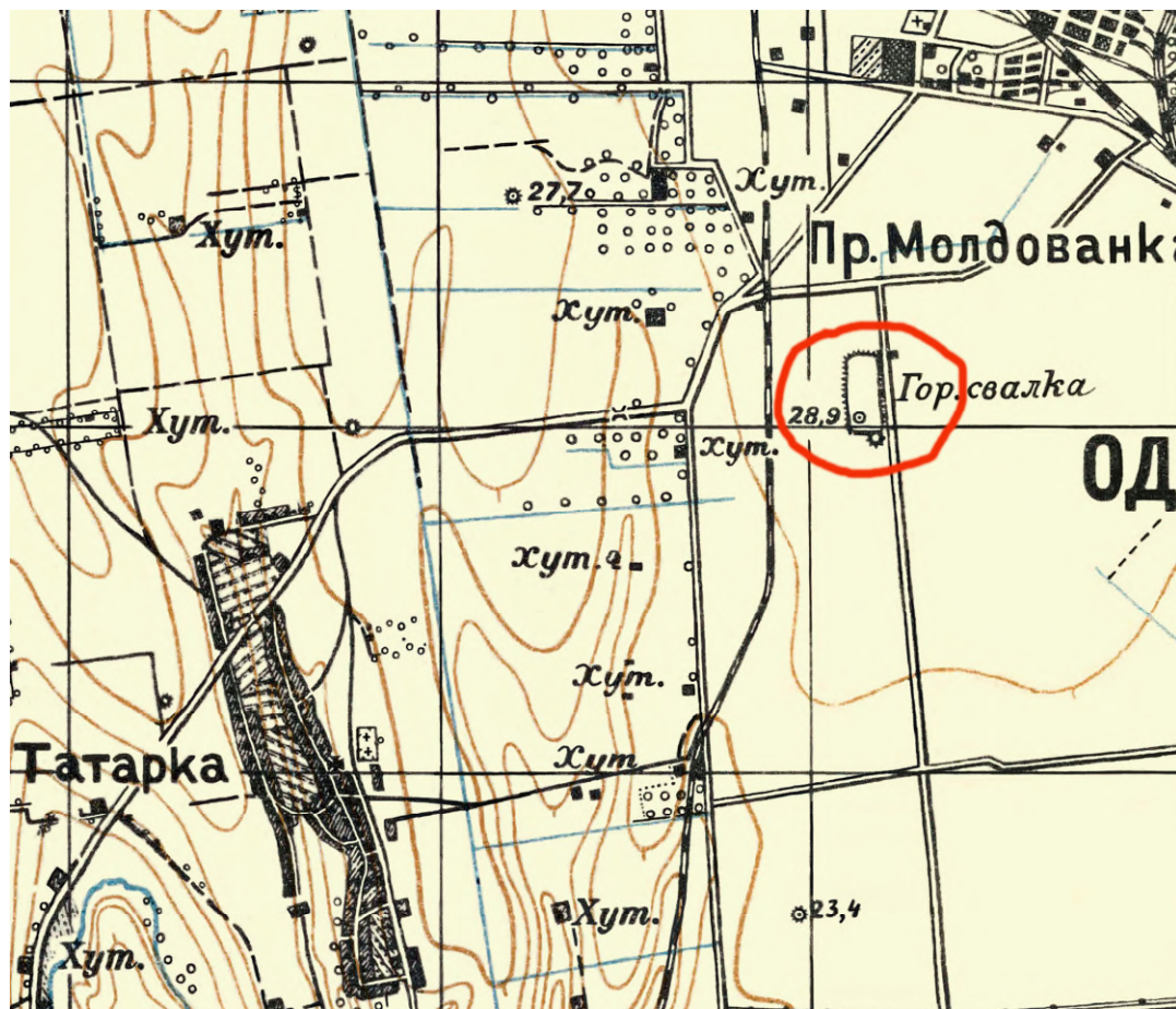
Рис. 1. Місце масових розстрілів під Одесою на карті 1917 р. (фрагмент)

ховувала протягом багатьох років. Так, більш ніж красномовним є факт, що коли у 1960-х роках під час прокладання траншеї для бензопроводу до аеропорту в районі 6-го км Овідіопольського шосе, ківш екскаватора підняв на поверхню грудку людських кісток і черепів, влада наказала все зарити й якнайшвидше забути про цю знахідку 4 .