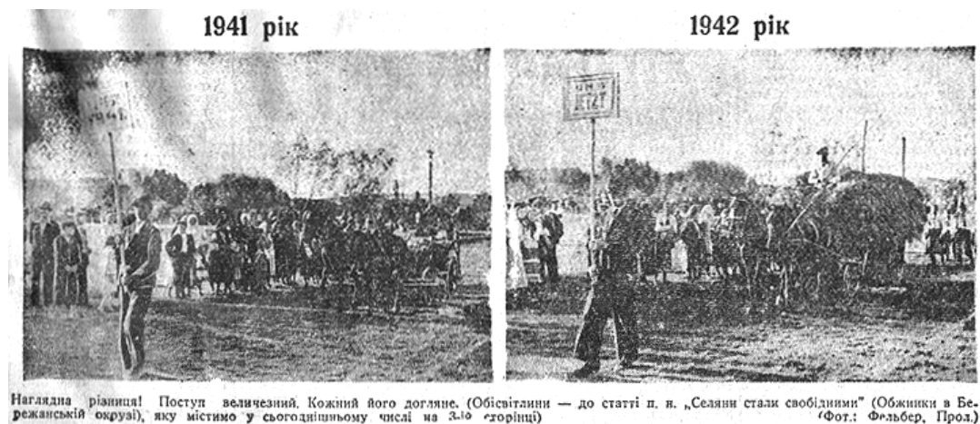
Рис. 10-11. Два фото зі свята обжинок у Бережанах («Львівські вісті» 6 жовтня 1942 р.)

Із газетних статей можна скласти уявлення про сільськогосподарські виставки, які відбувалися під час відзначення свята врожаю у деяких містах. Зокрема, восени 1943 р. у Станиславові така виставка була облаштована в колишніх казармах і мала павільйони, де експонувалися здобутки городництва та садівництва, елітні породи худоби, досягнення птахівництва та бджільництва 61 . У тому ж році, у день відзначення свята врожаю, подібна виставка проводилася в Херсоні. На ній демонструвалися експонати сільськогосподарських установ, які завдяки застосуванню агронаукових новацій, за словами анонімного автора статті, «наслідки одержали надзвичайні» 62 . Зокрема, він написав про гарбуз вагою 32 кг, цибулю вагою до 1 кг, цвітну капусту, насіння якої міське садівництво вперше одержало з Голландії, і «вона, порівнюючи з нашою доморослою – велетень», та бідкався, що «ми на своїх ділянках одержуємо таку нікчемну продукцію» 63 .