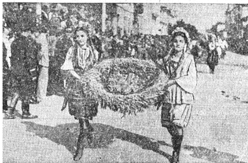
Свято обжинок у Стрию

Вулицями Стрия проходить врожистий похід