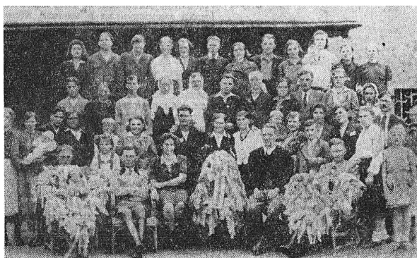
Рис. 12. Українські робітники на святі обжинок в маєтку Гроттау, район Рейхенберг у Судетах («Земля» (Плауен), 10 грудня 1944 р.)

Серед останніх згадок про відзначення свята врожаю, які зафіксовані в україномовній газетній періодиці часів окупації, можна назвати публікацію у тижневику «Земля» про прийняття 14 листопада 1944 р. очільником Генеральної Губернії Гансом Франком делегації українських землеробів з нагоди «обжинок» 102 . Фактично це була делегація від невеличкого клаптика української території в Генеральній Губернії (на Лемківщині), який на той час ще не зайняла Червона армія. Очільник делегації, голова Українського центрального комітету Володимир Кубійович, просив прийняти скромні «символічні дарунки такі, як убога країна», з якої ця делегація виїхала, а на закінчення свята «хор відспівав низку українських народних пісень» 103 .