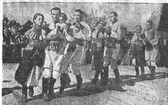
Окружні обжинки в Чорткові

Молодь Добрівлян, Заліщицького повіту, учасники свята обжинок у Чорткові, танцює українські народні танці.