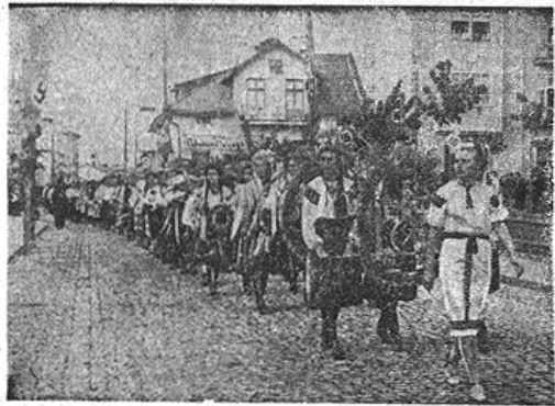
У перших рядах підчас походу на святі обжюнок у Калушині, йшли українські дівчата