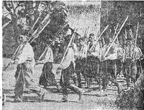
Сцена зі свята обжюнок у Станиславові