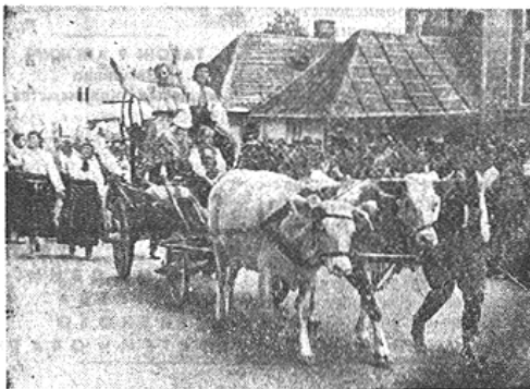
Свято обжюнок вивначається великою природністю: у Станиславові підчас почетного ходу селянства бачили ми і таку сцену, як на нашій світліні