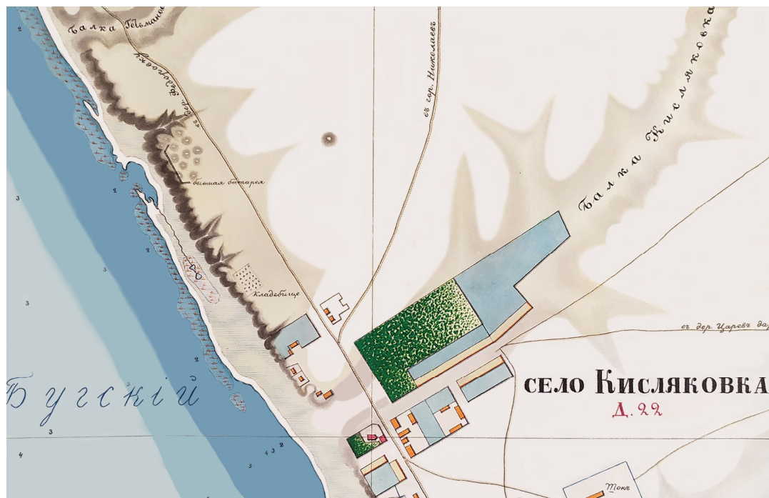
Рис. 10. Район с. Кисляківки на плані А.П. Чиркова 1863 р. (зберігається в ОАМ).