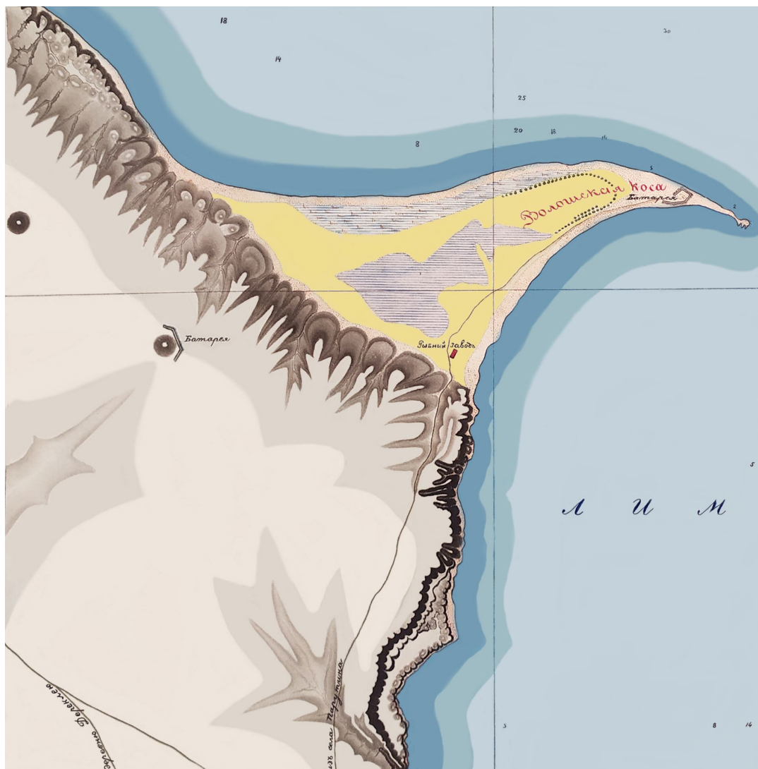
Рис. 11. Волоська коса на плані А.П. Чиркова 1863 р. (зберігається в ОАМ).