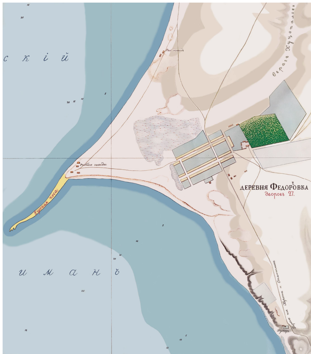
Рис. 9. Руська коса на плані А.П. Чиркова 1863 р. (зберігається в ОАМ).