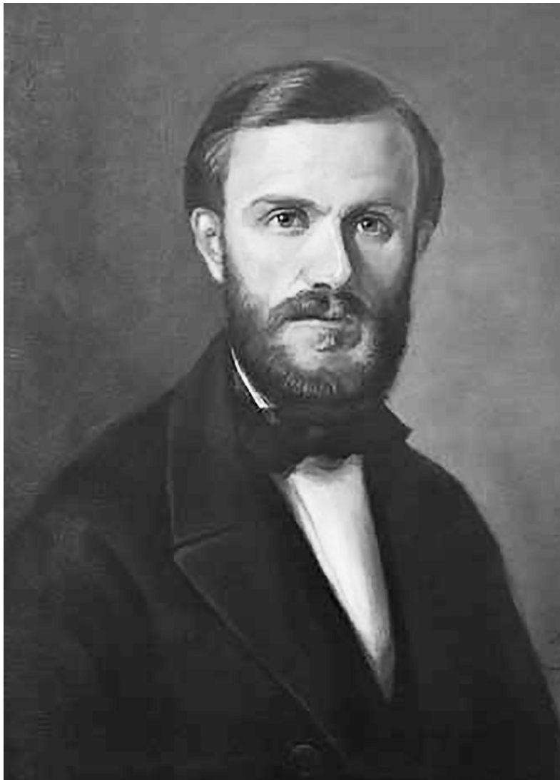
Рис. 1. Якоб Йохан Вільгельм Лагус (з портрета роботи Іди Сільфверберг).