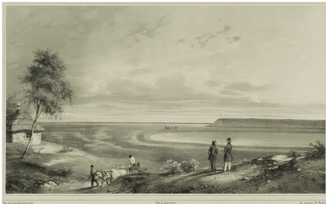
Рис. 3. Вигляд пересипу Тилігульського лиману з лівого берега у 1848 р. (гравюра з малюнка М. Вебеля).