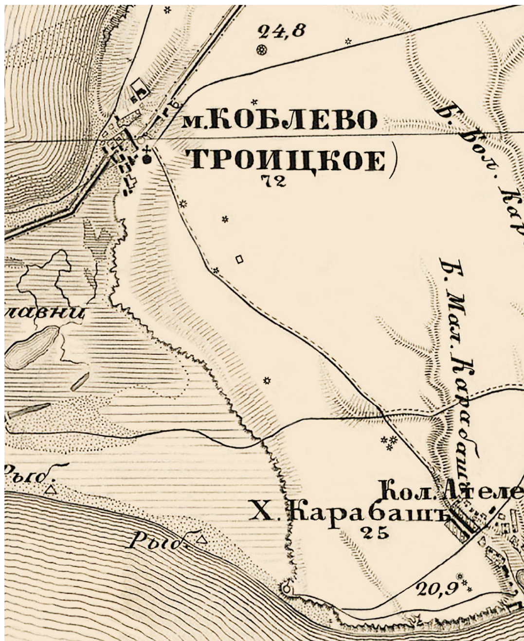
Рис. 5. Частина пересипу і лівого берега Тилігульського лиману на «триверстовій» карті (1869-х рр.; аркуш XXX-9; ф-т).