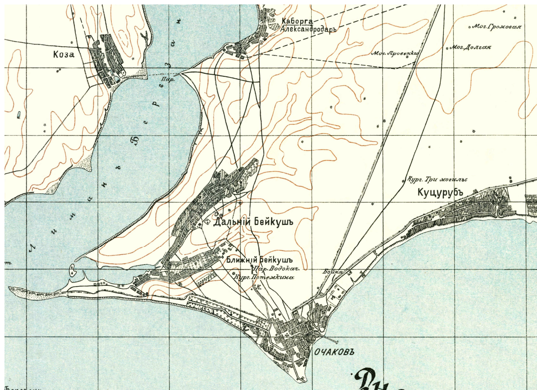
Рис. 8. Район Очакова на «двохверстовій» карті (1907-1908 р.; аркуш XLV-32; ф-т).