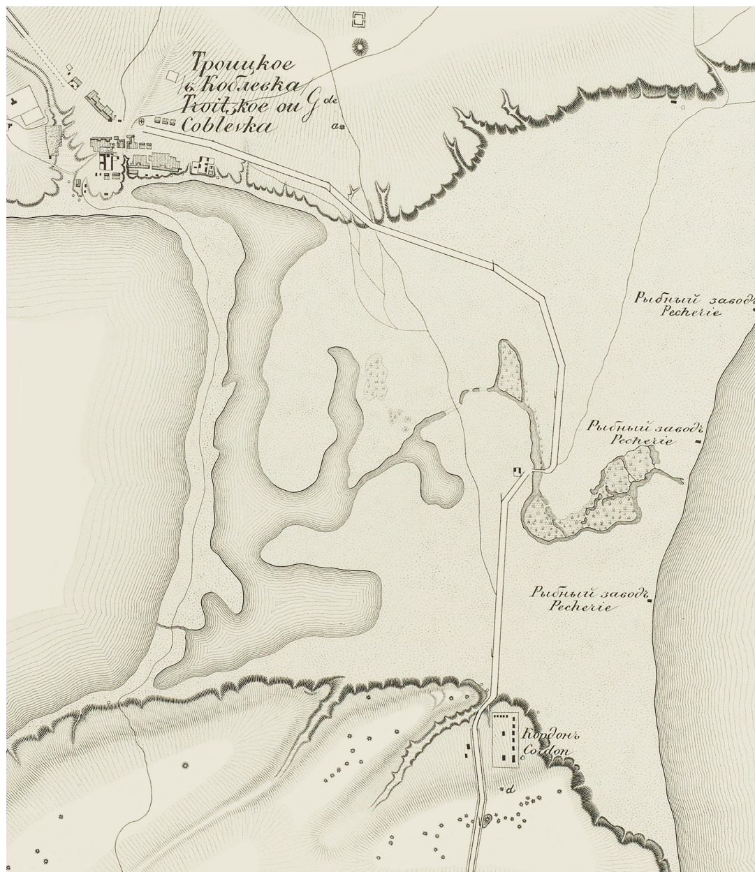
Рис. 2. Пониззя Тилігульського лиману в 1848 р. (план А. Олексійова; ф-т).