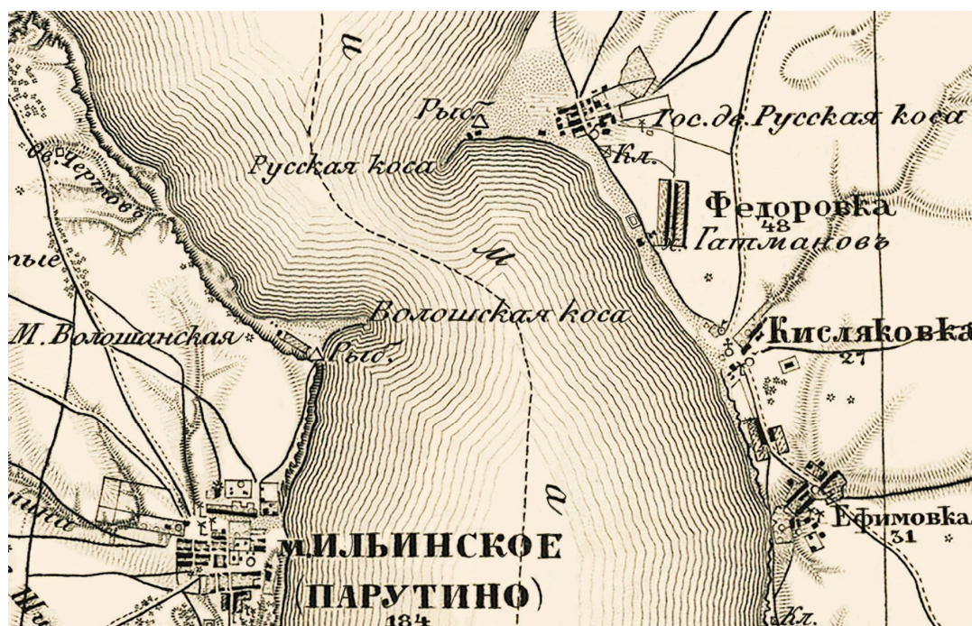
Рис. 7. Район Волошанської і Руської кос на «триверстовій» карті (1869 р.; аркуш XXX-10; ф-т).