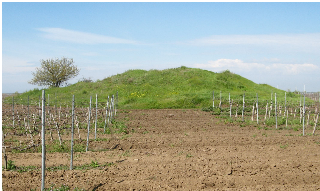
Рис. 12. Курган Вільгельма Лагуса поблизу с. Коблева у 2021 р. (вигляд зі сходу)